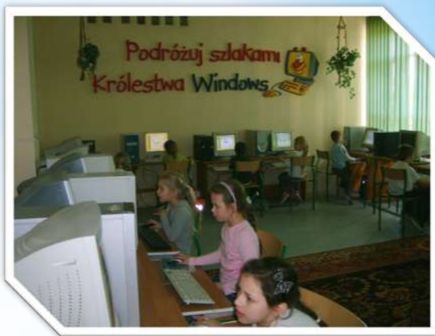
Szkoła Podstawowa nr 12