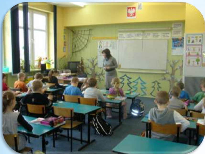
Szkoła Podstawowa nr 1