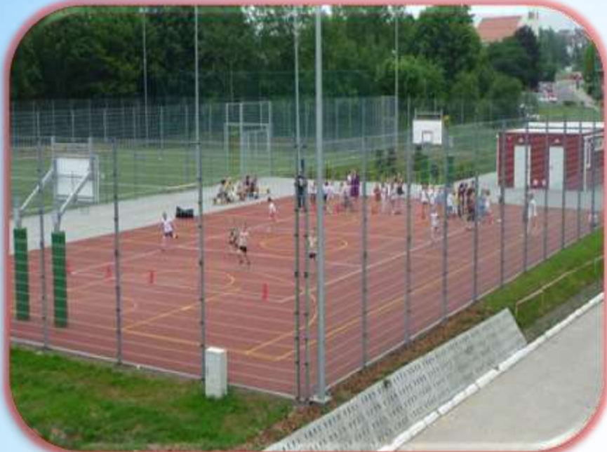
Orlik - Szkoła Podstawowa nr 11