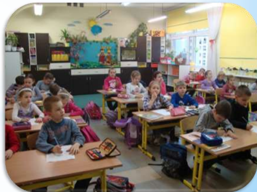
Szkoła Podstawowa nr 9