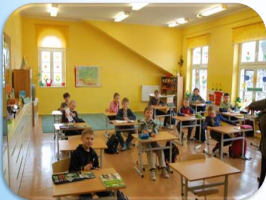
Szkoła Podstawowa nr 8