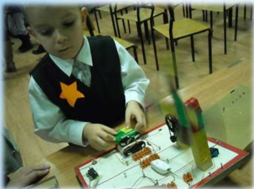
sala eksperymentów w SP 25