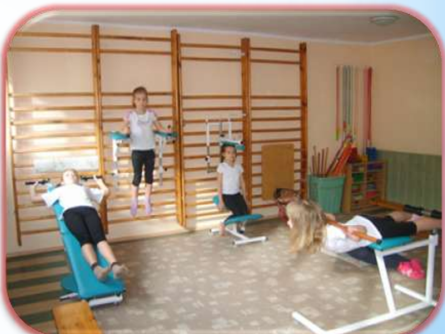
Gimnastyka korekcyjna SP 12