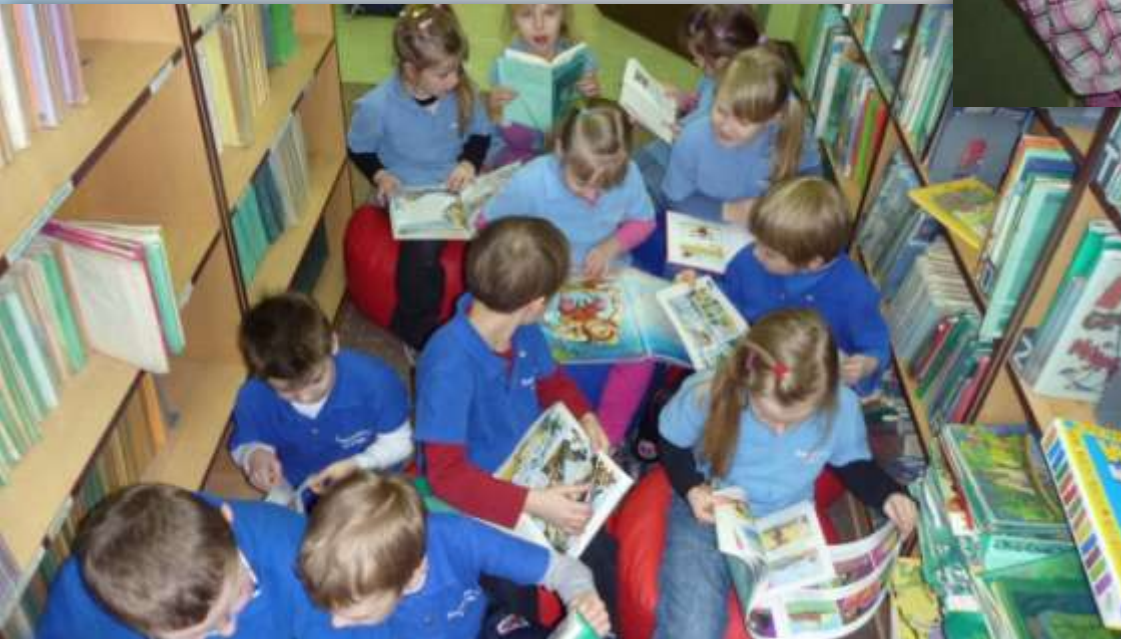
Szkoła Podstawowa nr 11