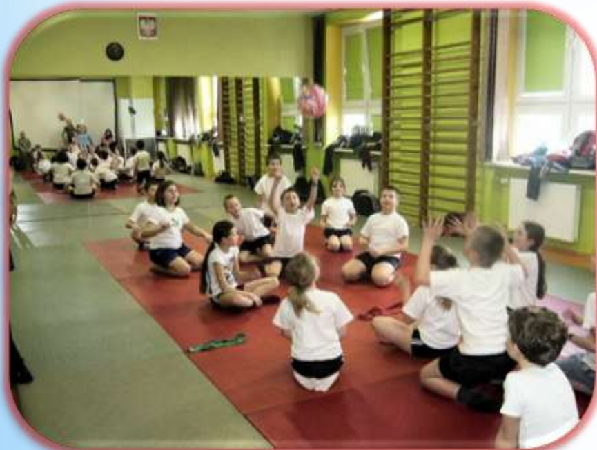
Zajęcia sportowe SP 1