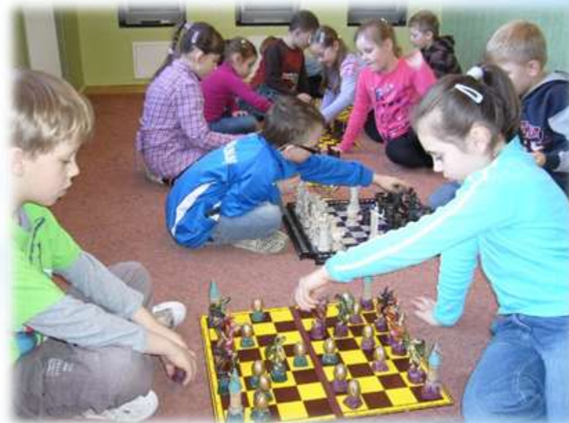
koło szachowe w SP 1