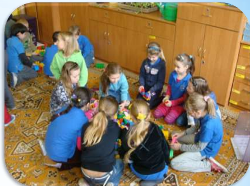
Szkoła Podstawowa nr 6