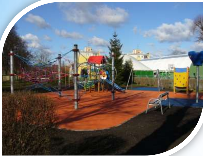
Plac zabaw - Szkoła Podstawowa nr 1