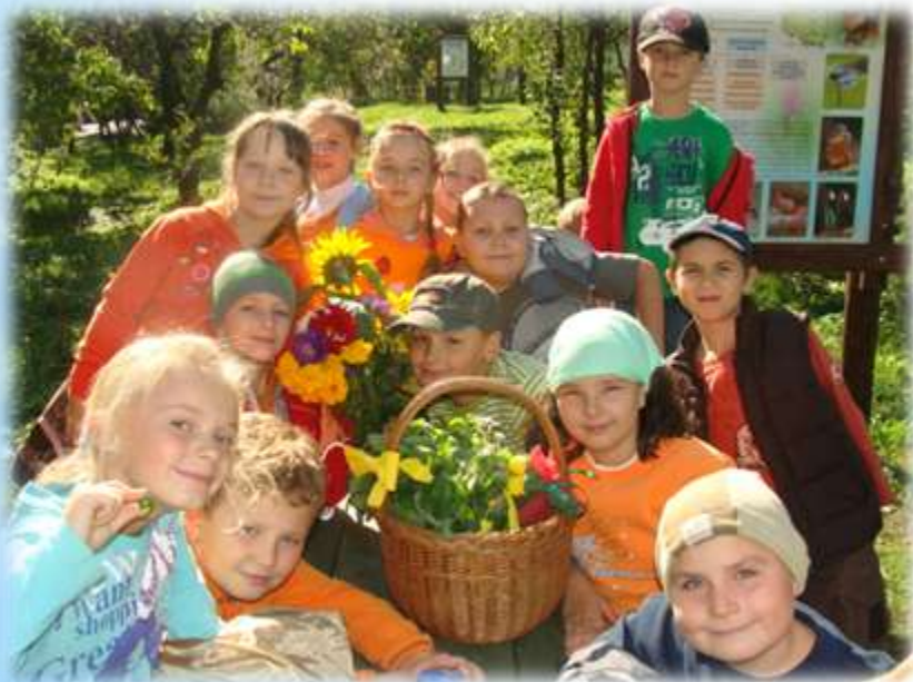
zajęcia przyrodnicze w SP 18