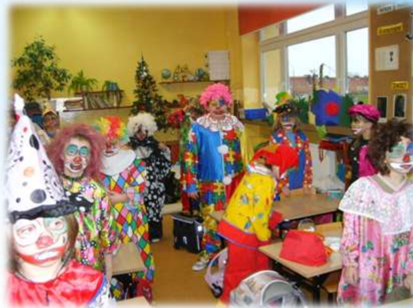
zajęcia teatralne w SP 15