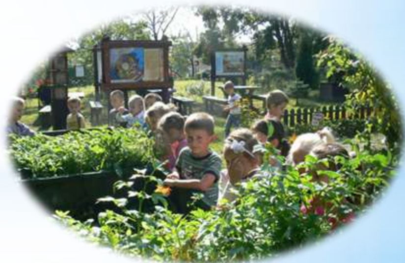
Mamy własne przyprawy ze szkolnego ogródka - Szkoła Podstawowa nr 18