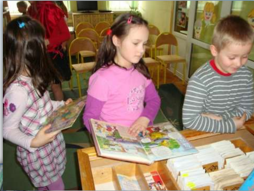
Szkoła Podstawowa nr 15

Już najmłodszy uczniowie korzystają ze zbiorów biblioteki szkolnej