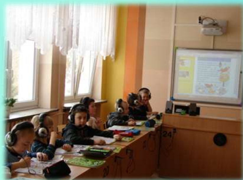
Szkoła Podstawowa nr 23