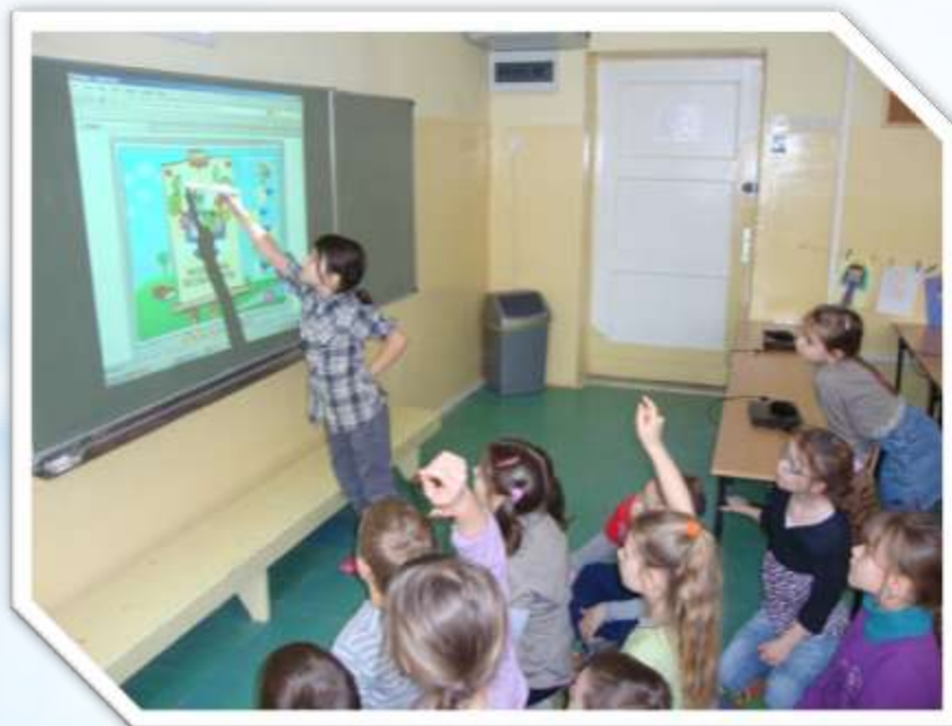
Szkoła Podstawowa nr 4