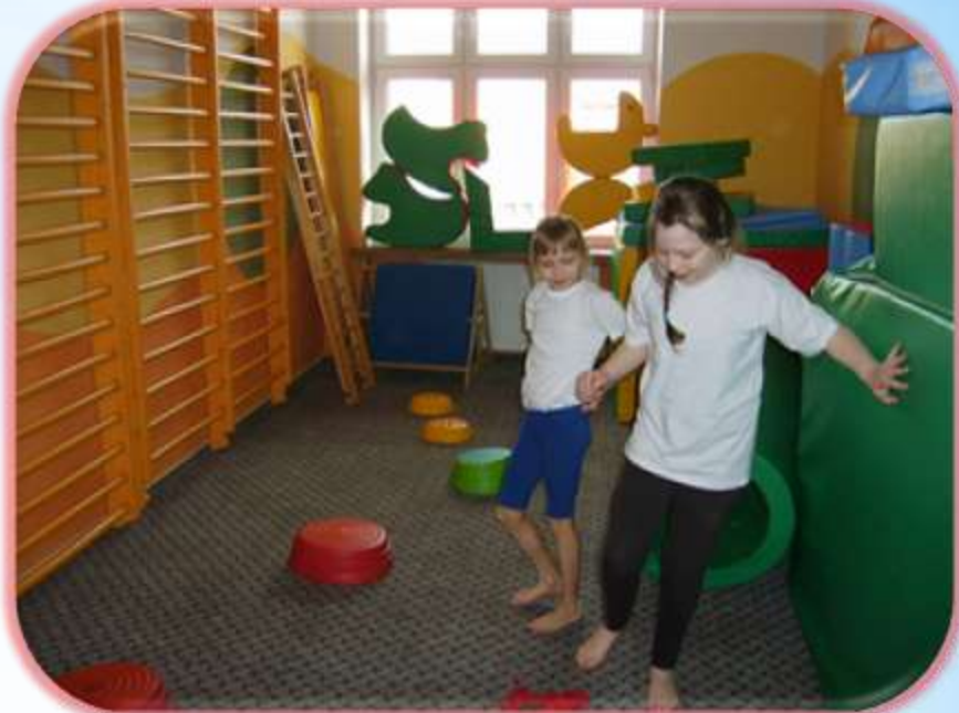
Gimnastyka korekcyjna SP 15