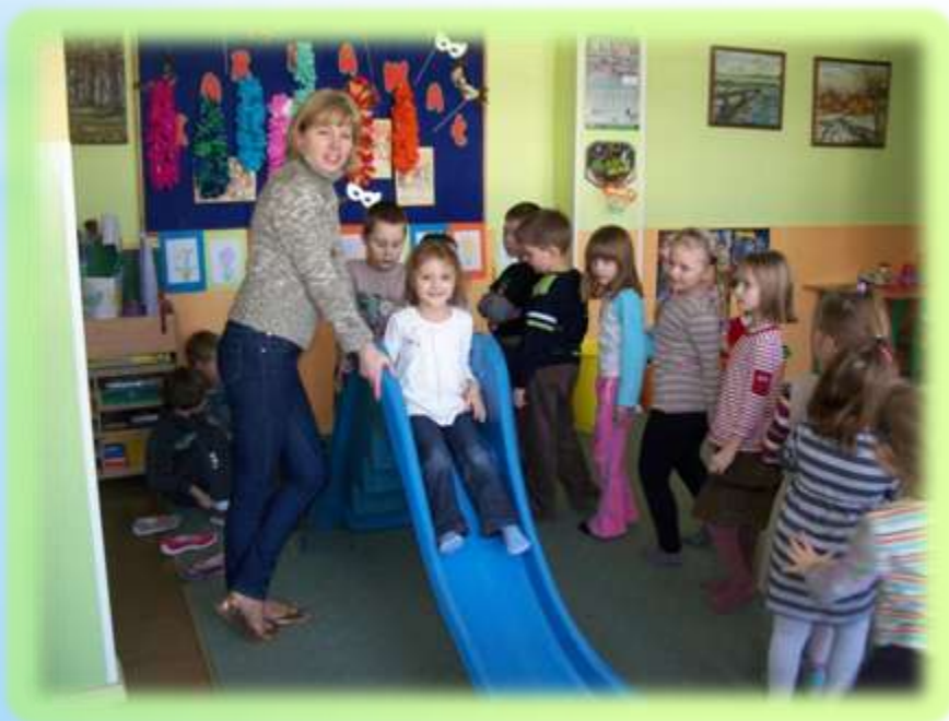
Szkoła Podstawowa nr 19