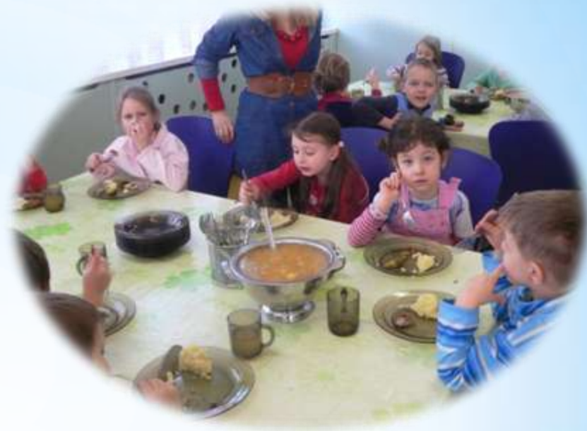
Jemy obiad - Szkoła Podstawowa nr 21