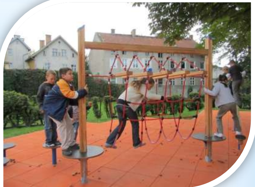
Plac zabaw - Szkoła Podstawowa nr 19