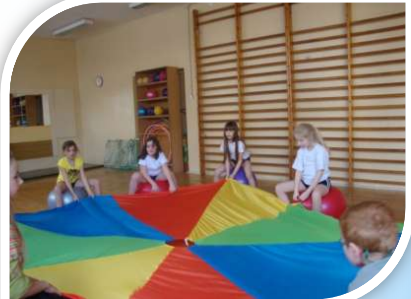
Szkoła Podstawowa nr 9