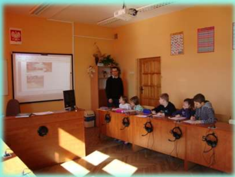
Szkoła Podstawowa nr 14