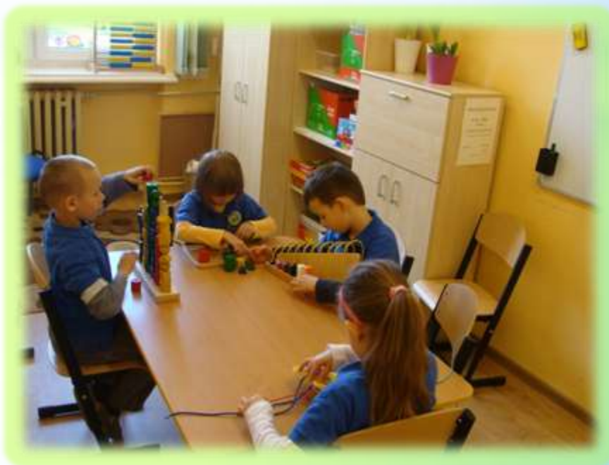
Szkoła Podstawowa nr 6