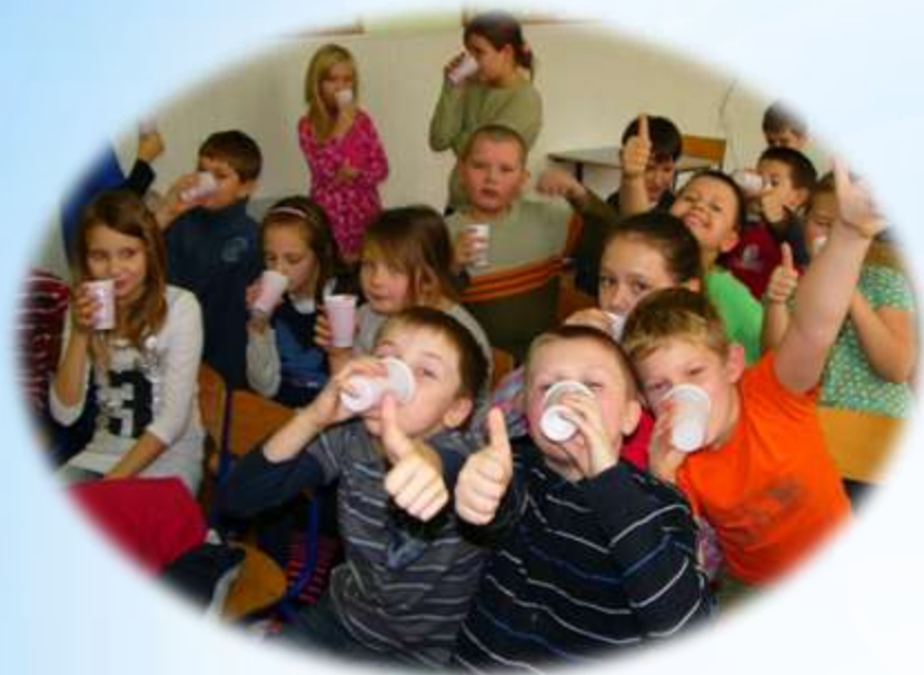
Pijemy soki - Szkoła Podstawowa nr 16