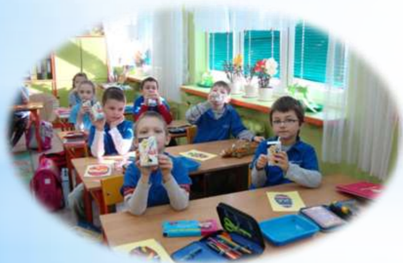
Pijemy mleko - Szkoła Podstawowa nr 11