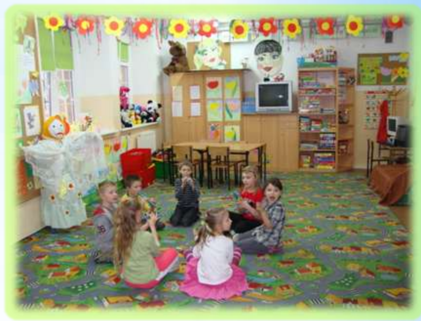
Szkoła Podstawowa nr 4