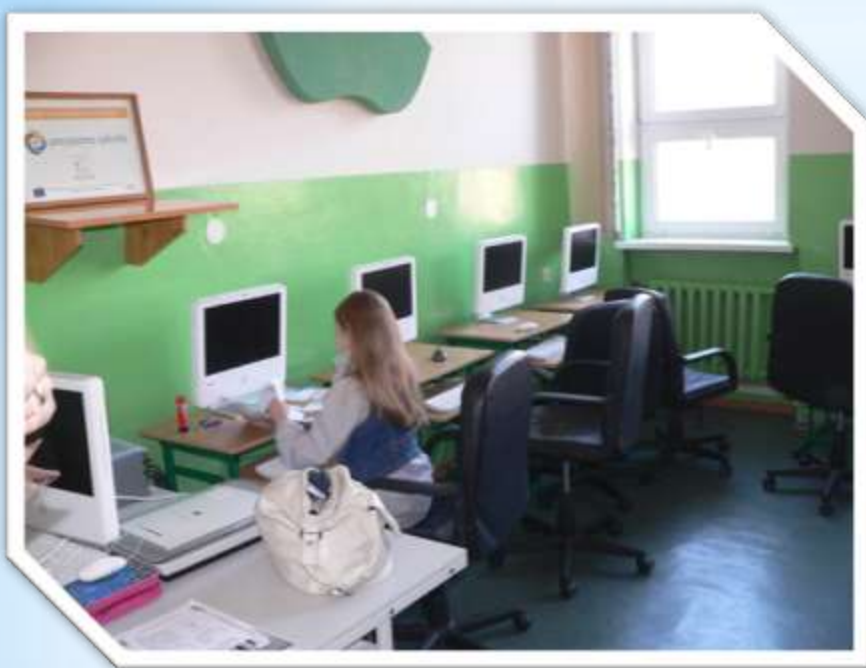
Szkoła Podstawowa nr 21