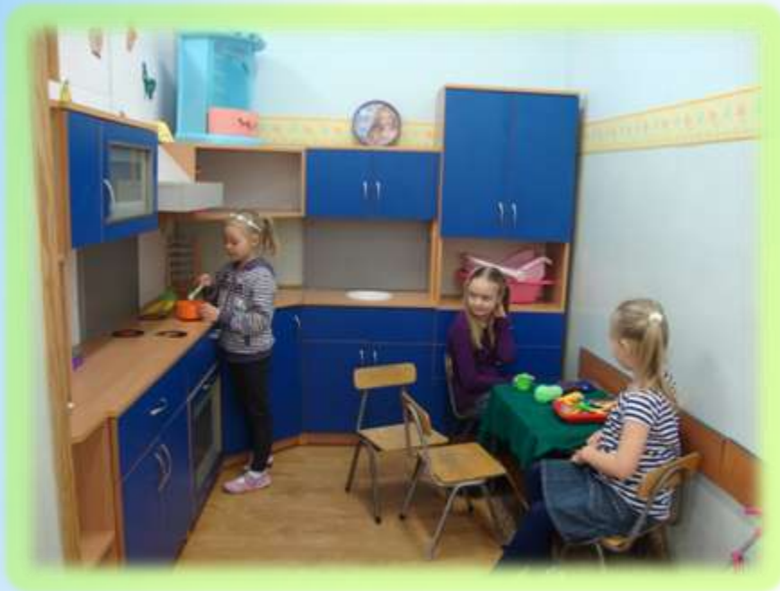
Szkoła Podstawowa nr 9