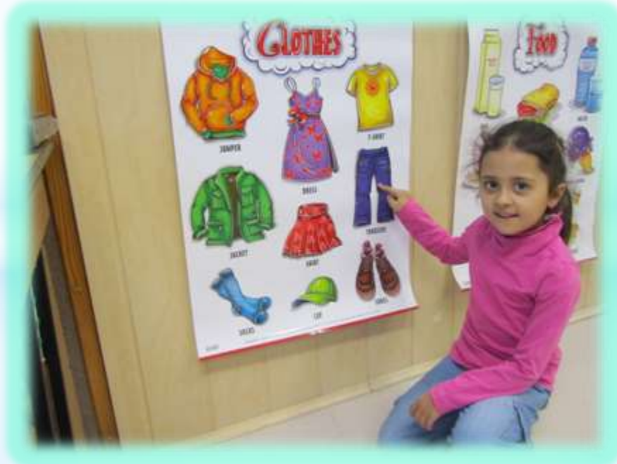
Szkoła Podstawowa nr 19