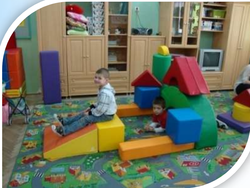
Szkoła Podstawowa nr 14